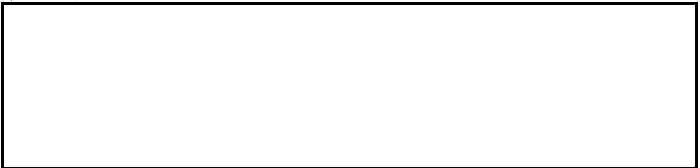
レーダーチャート